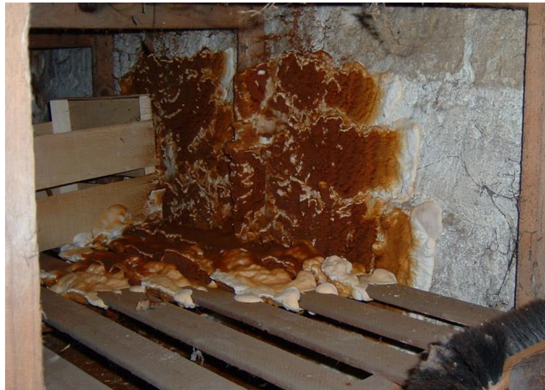
Termites, mérules et autres xylophages