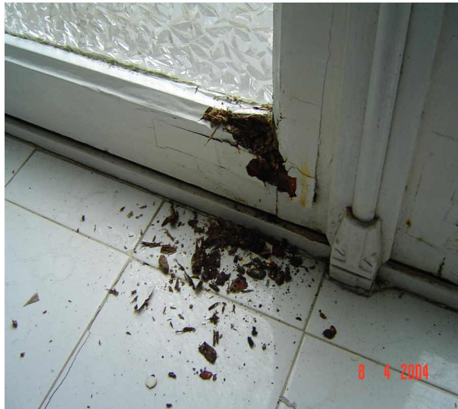
Termites, mérules et autres xylophages