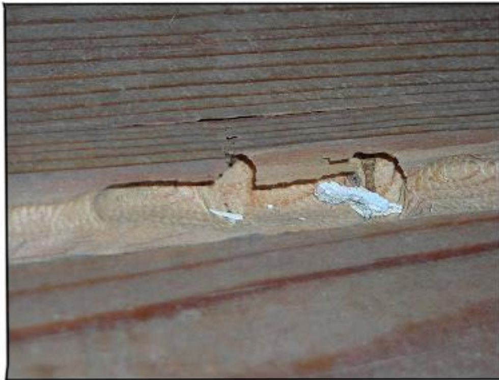
Termites, m\u00e9rules et autres xylophages