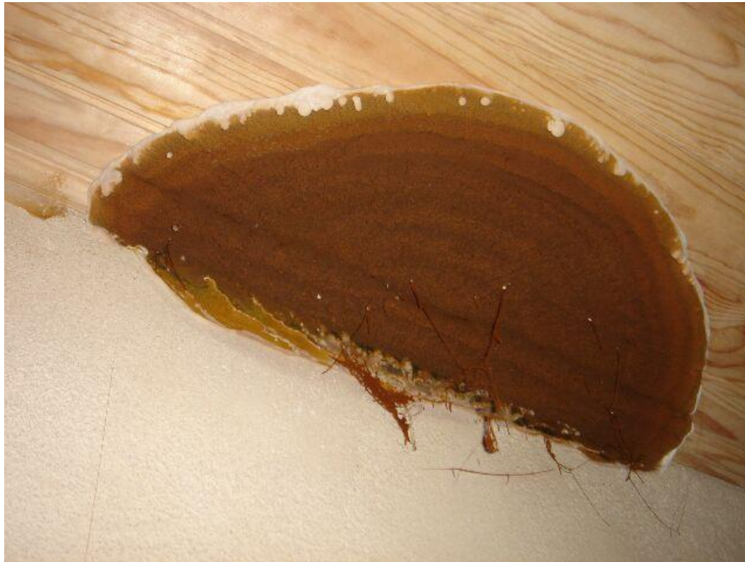
Termites, m\u00e9rules et autres xylophages