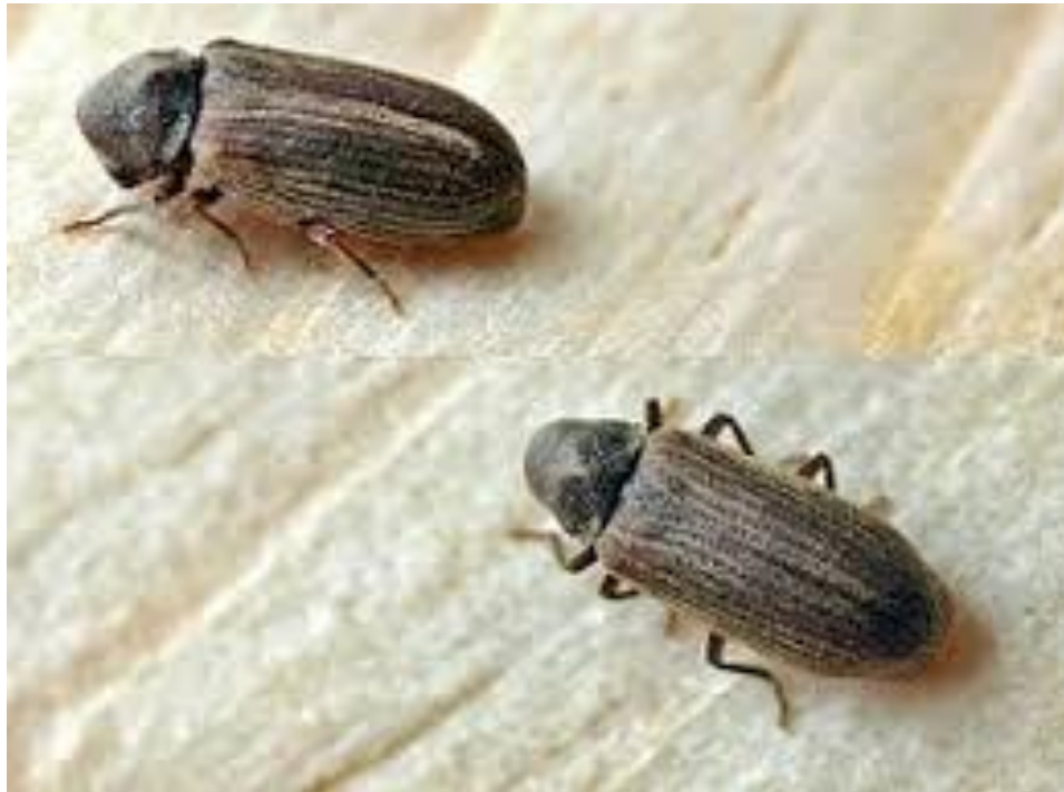
Termites, mérules et autres xylophages