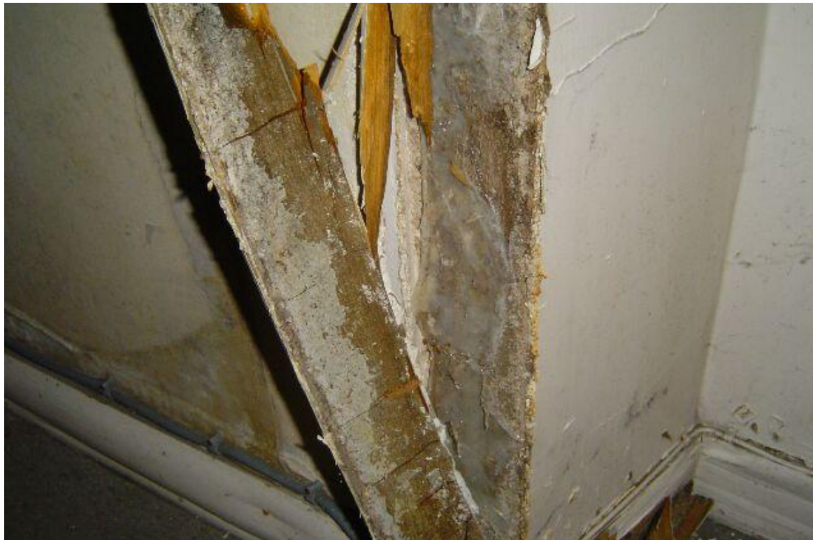
Termites, m\u00e9rules et autres xylophages