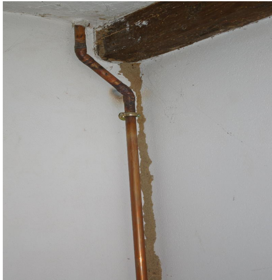
Termites, m  rules et autres xylophages