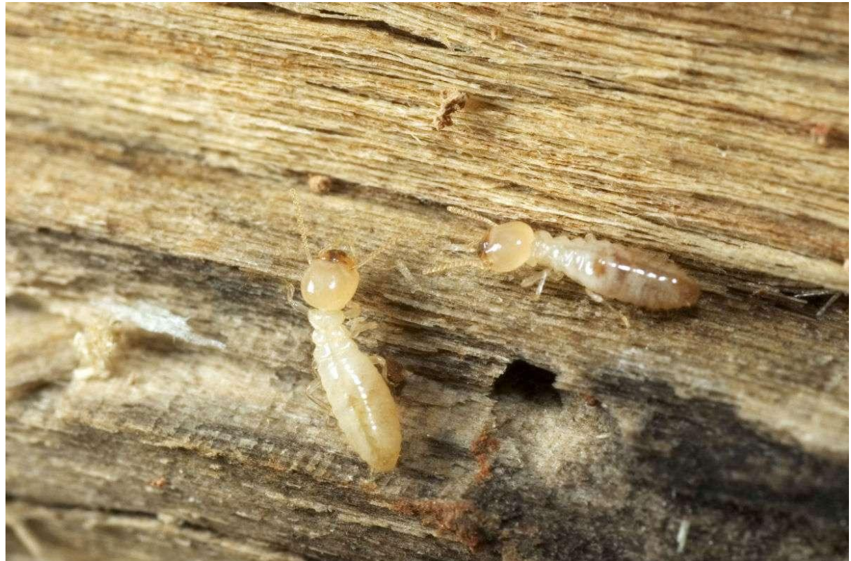
Termites, mères et autres xylophages