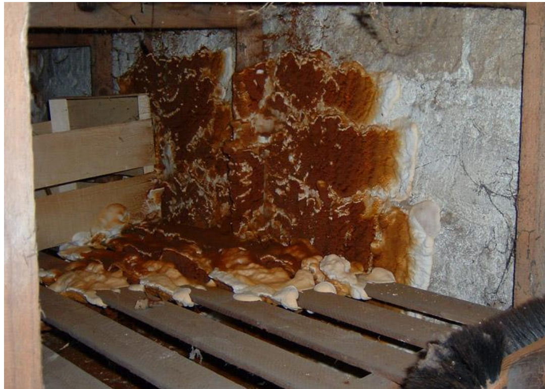
Termites, mérules et autres xylophages