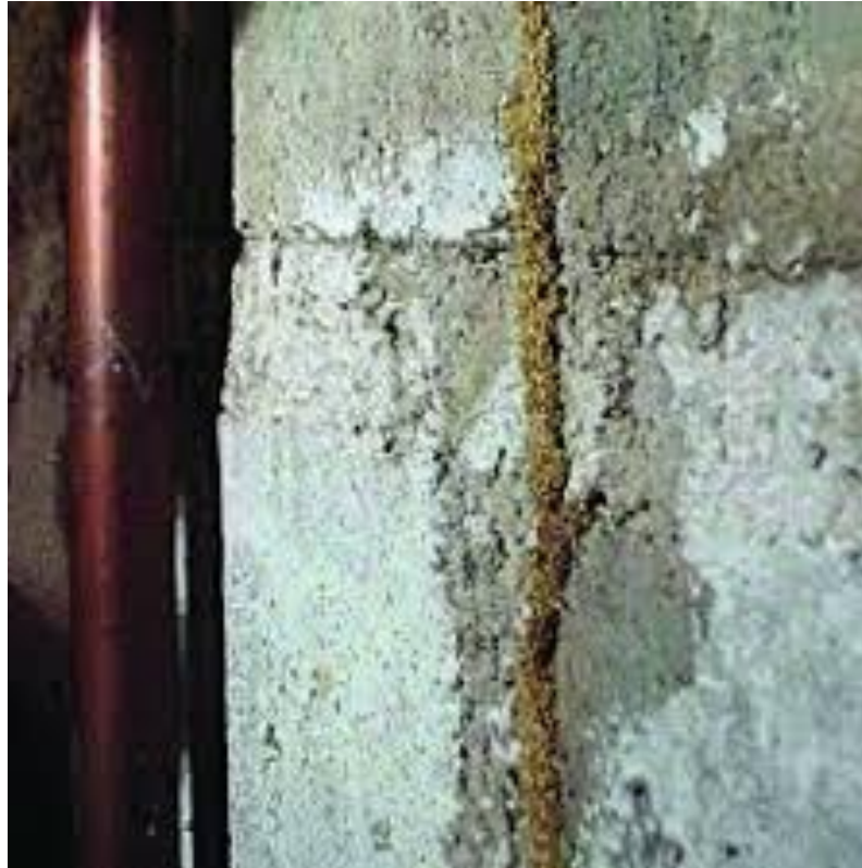
Termites, mérules et autres xylophages