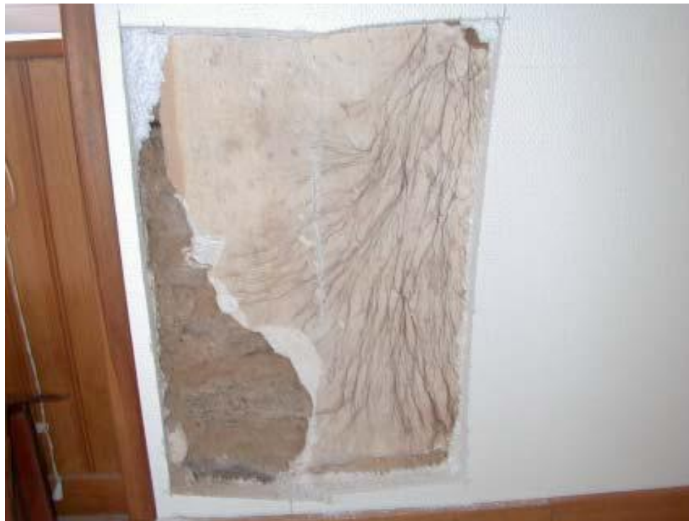
Termites, mérules et autres xylophages