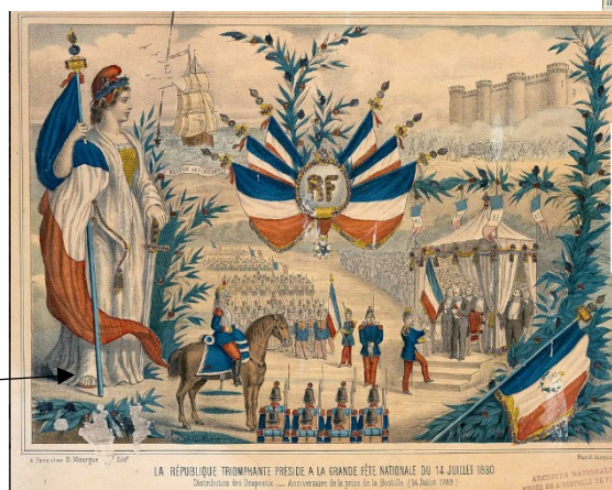
Photo E : La République triomphante préside à la grande fête nationale du 14 juillet 1880

Enseignement SLG1NNUC01: Sociologie Politique