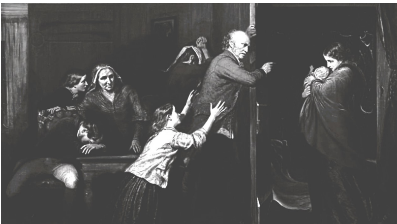
Illustration: The Outcast de Richard Redgrave (1851)

Question de réflexion illustrée (30 à 40 lignes) : Comment expliquer le recours à l'abandon en France aux XVIIIe et XIXème ? Illustration: The Outcast de Richard Redgrave (1851)